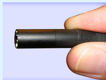
9,2 mm diameter