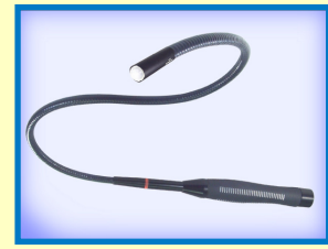
RobiCam 15 501 033 7