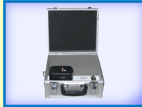
Aluminiumväska med batteri 501 033 502