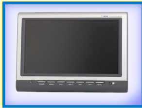
7" LCD-TFT bildskärm 501 033 104