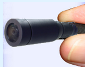
15 mm diameter