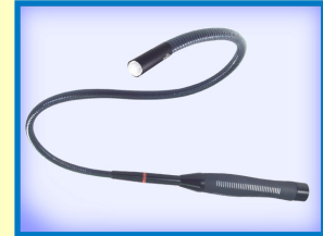
RobiCam 9 501 033 6