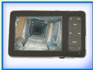
3" bildskärm med inspelning på minskort 501 033 102