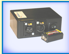
Batteripack 12V 501 033 501