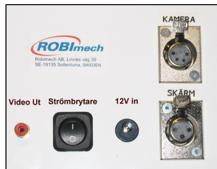
Panel i kameraväska